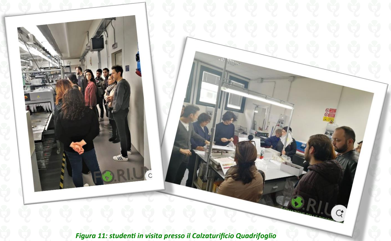
Figura 11: studenti in visita presso il Calzaturificio Quadrifoglio

accogliendo presso il proprio stabilimento produttivo corsisti interessati a conoscere alcuni dei segreti di questo mestiere, per poi farne tesoro nel loro prossimo futuro.