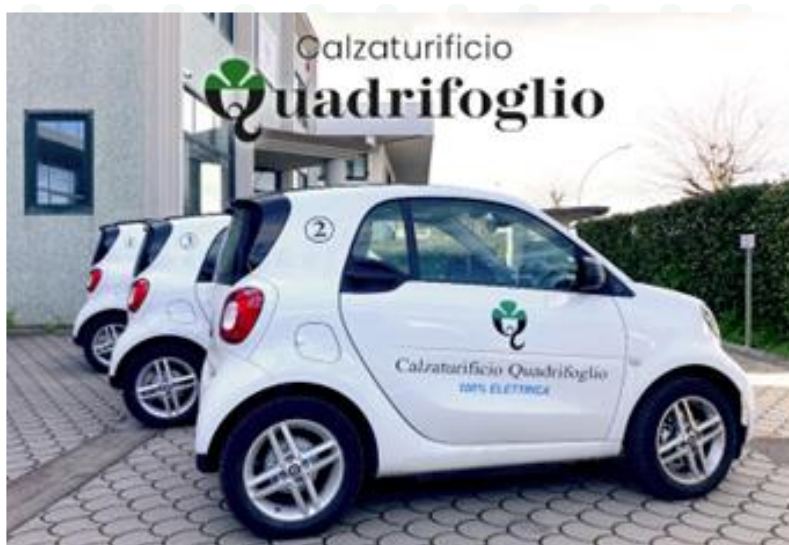
Figura 7: parco macchine elettriche

Tra le iniziative recentemente promosse dal Calzaturificio Quadrifoglio a supporto della propria sostenibilità si segnala l'acquisizione di Smart 100% elettriche, che ha dato il via al rinnovamento del parco macchine, che condurrà in breve l'azienda ad avere il 100% di mobilità sostenibile.