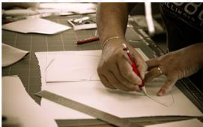
Figura 2: modelleraia

Il calzaturificio ha un dipartimento appositamente dedicato a questa importante fase, che è composto da 4 Modellisti Senior e 2 Modellisti Junior i quali operano sia tramite il sistema CAD, che alla vecchia maniera con la camicia modellata sulla forma a cui segue il reparto taglio e aggiunteria.