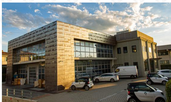
Figura 1: Lo stabilimento