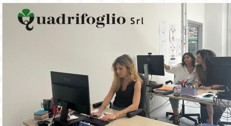
Figura 5: Pianificazione della produzione

Il Calzaturificio Quadrifoglio, grazie ad un sistema basato sull'Intelligenza Artificiale integrato e verticalizzato sulle risorse, tende all'ottimizzazione della produzione e alla riduzione degli sprechi di tempo.