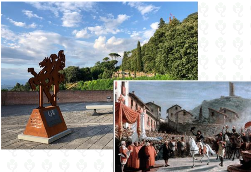
Figura 13: Scultura "Napoleone Bonaparte su cavallo rampante"

Sostenere le opere pubbliche che testimoniano la storia italiana è uno dei doveri civici in cui crede il Calzaturificio Quadrifoglio. Partecipare alla conservazione della memoria e alla diffusione della conoscenza dell'identità storica di un popolo, è dunque una delle missioni del calzaturificio che ha recentemente contribuito alla realizzazione della scultura di "Napoleone Bonaparte su cavallo rampante" realizzata da Marco Puccinelli e posta in piazza del Bastione a San Miniato (PI) in occasione dei 200 anni della sua morte e in ricordo della venuta di Napoleone a San Miniato nel 1796.