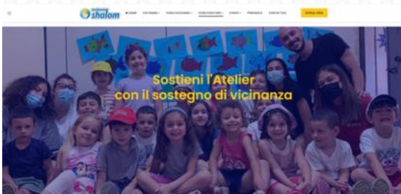
Figura 14: progetto Atelier del Movimento Shalom

Nel 2024 Quadrifoglio ha trasformato i propri auguri di Natale in un gesto concreto di solidarietà contribuendo ad un progetto del Movimento Shalom, sostenendo il progetto Atelier, doposcuola e ludoteca per bambini e ragazzi da 3 a 13 anni, a San Miniato.