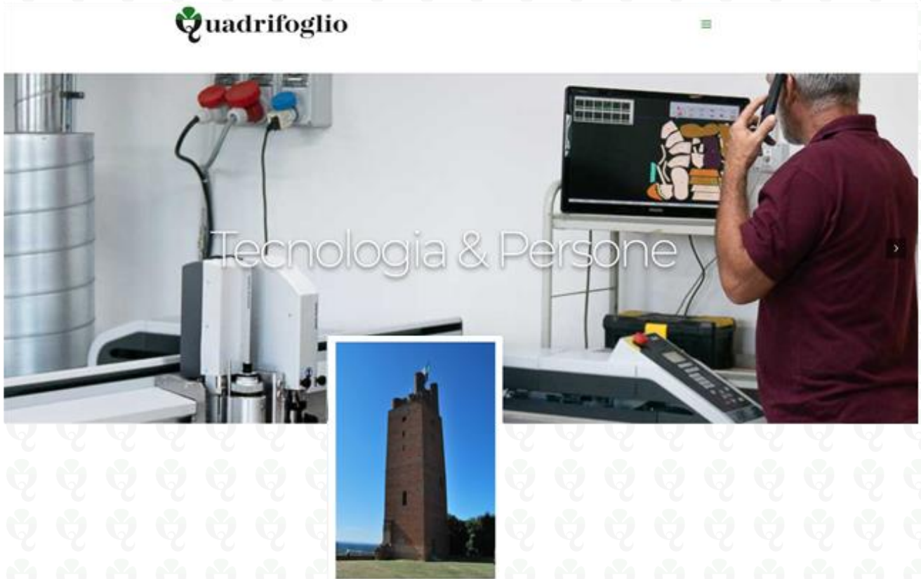
Figura 6: l'importanza delle persone

Il Team di lavoro del Calzaturificio Quadrifoglio è composto da persone che lavorano giornalmente con entusiasmo, creatività, professionalità nel rispetto dei valori della cultura: semplicità, armonia, funzionalità. Grazie ad una struttura organizzativa flessibile ed efficiente, l'azienda, trasmette in ogni progetto questi principi, realizzando soluzioni di alto livello qualitativo.