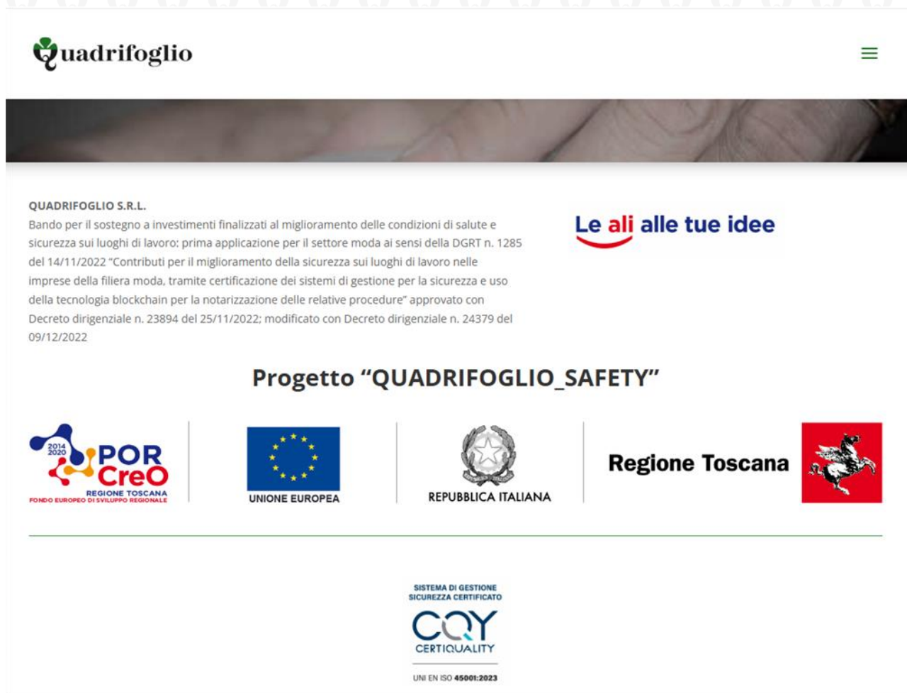
Figura 8. progetto finanziato per la salute e sicurezza sui luoghi di lavoro

Tale risultato è stato conseguito anche grazie alla realizzazione di un progetto finanziato per il sostegno a investimenti finalizzati al miglioramento delle condizioni di salute e sicurezza sui luoghi di lavoro (Progetto "Quadrifoglio Safety" approvato con Decreto dirigenziale n. 23894 del 25/11/2022; modificato con Decreto dirigenziale n. 24379 del 09/12/2022).