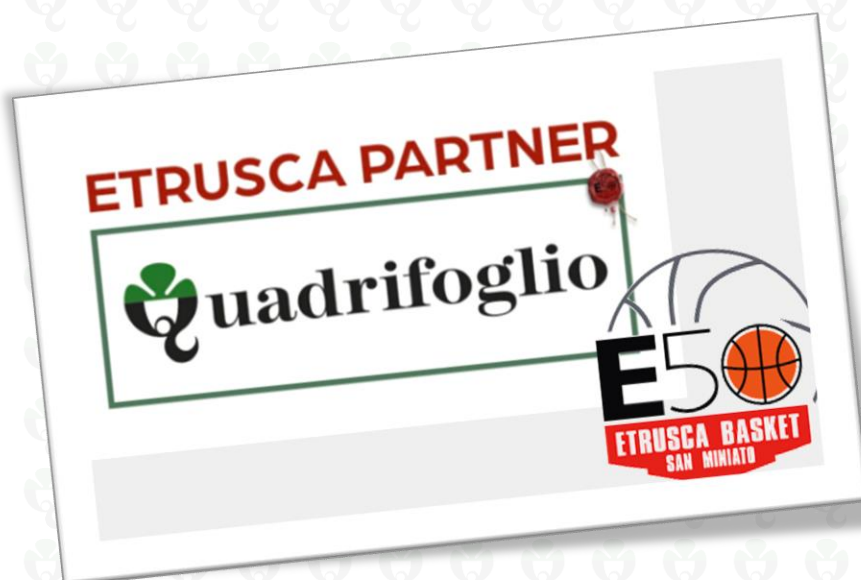
Figura 10: Quadrifoglio sponsorizza la squadra di basket di San Miniato

Il Calzaturificio Quadrifoglio è fermamente convinto che lo sport non sia soltanto gioco ma una via per unire popoli e razze, per aiutare a vincere le paure, a superare la fatica e a vincere le difficoltà. Sponsorizzare atleti, squadre ed eventi sportivi significa sostenere questi valori. Per tale motivo da tempo l'azienda sponsorizza la Società Sportiva di basket di San Miniato Etrusca Partner.