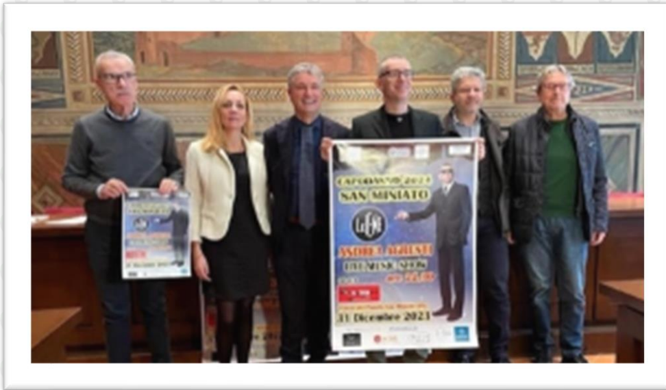
Figura 12: Quadrifoglio sponsorizza la festa di Capodanno 2023/2024 in Piazza a San Miniato